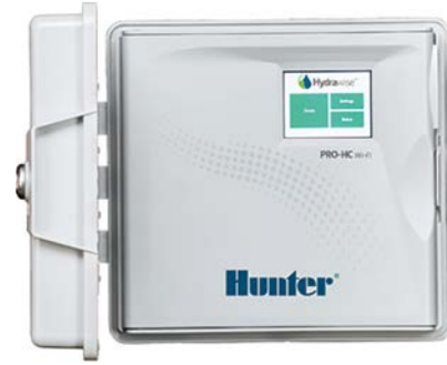
Pro-HC (Innensteuergerät aus Kunststoff) Höhe: 21 cm Breite: 24 cm Tiefe: 8,8 cm

Testen Sie die Hydrawise-Software direkt, auch ohne Steuergerät unter hydrawise.com