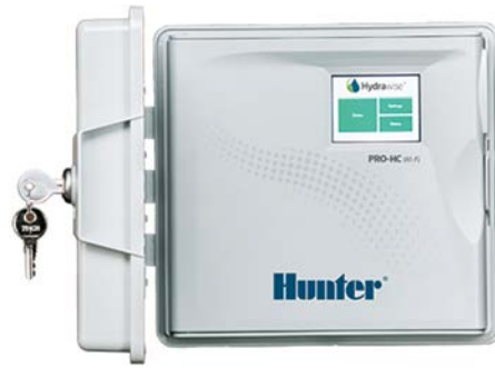
Pro-HC (Außensteuergerät aus Kunststoff) Höhe: 22,8 cm Breite: 25 cm Tiefe: 10 cm