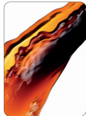
Boissons sans alcool / Alkoholfreie Getränke