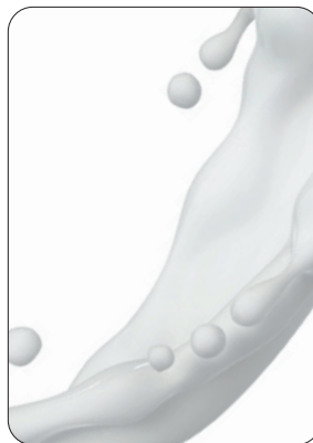
Lait / Milch