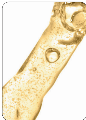
Bière / Bier